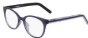
501 Crystal Court Purple