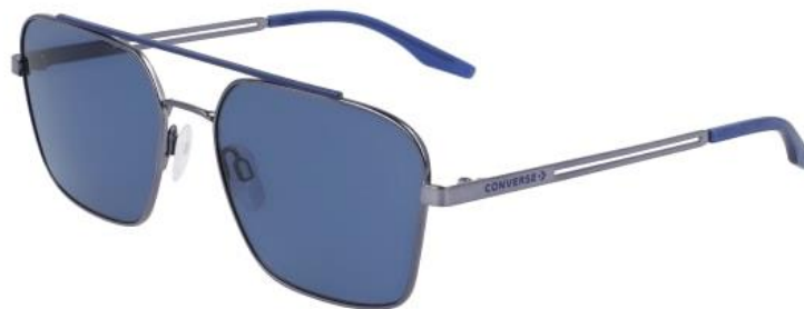
070 Satin Gunmetal/Navy Solid Blue Lens