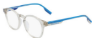
260 Crystal String