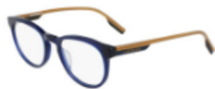
411 Crystal Obsidian