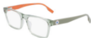
331 Crystal Light Surplus