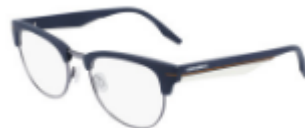
411 Matte Obsidian