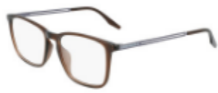
201 Crystal Dark Root