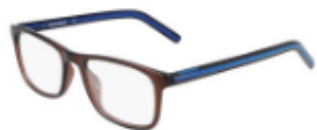
201 Crystal Dark Root