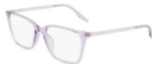
530 Crystal Infinite Lilac