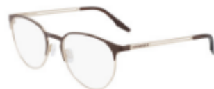
201 Matte Dark Root