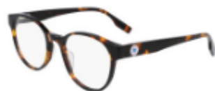
239 Dark Tortoise