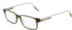
310 Crystal Dark Moss