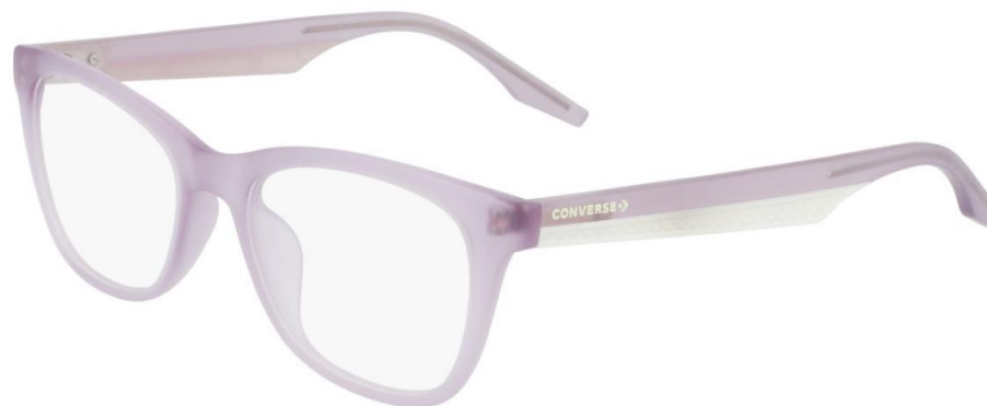
530 Matte Crystal Infinite Lilac