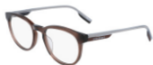
201 Crystal Dark Root