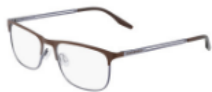
201 Matte Dark Root