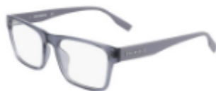
020 Crystal Light Carbon