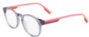
020 Crystal Light Carbon