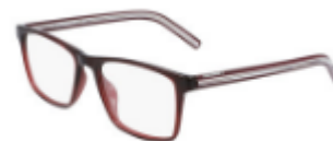
610 Crystal Team Red