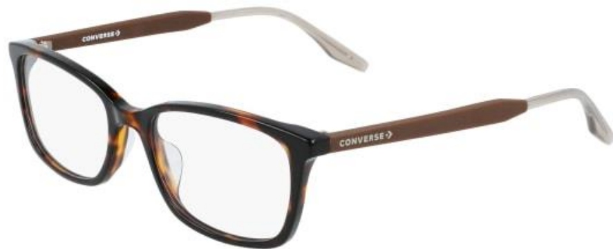
239 Dark Tortoise