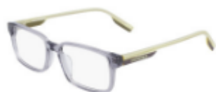
020 Crystal Light Carbon