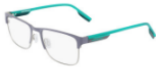
020 Matte Light Carbon