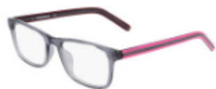
020 Crystal Light Carbon