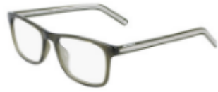
310 Crystal Dark Moss