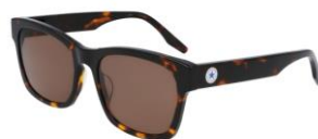
239 Dark Tortoise Solid Brown Lens