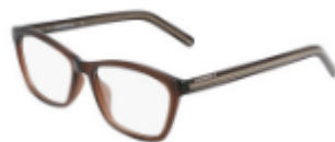
201 Crystal Dark Root