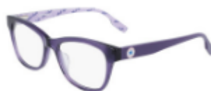
501 Crystal Court Purple