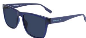
410 Crystal Midnight Navy Solid Blue Lens