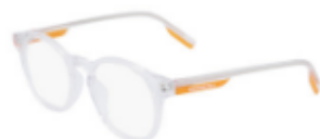
970 Crystal Clear