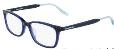
411 Crystal Obsidian