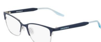
411 Matte Obsidian