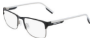
001 Matte Black