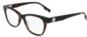
239 Dark Tortoise