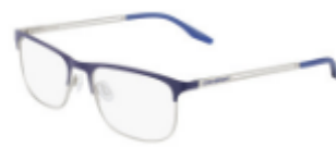
410 Matte Midnight Navy