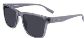
020 Crystal Light Carbon Silver Mirror Lens