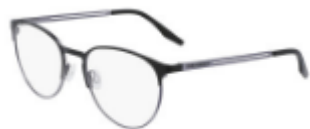
001 Matte Black