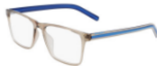
260 Crystal String