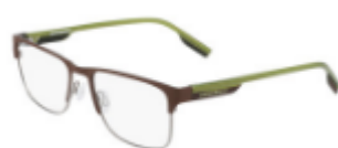
201 Matte Dark Root