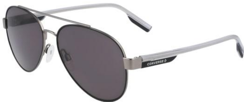
001 Matte Black Solid Smoke Lens