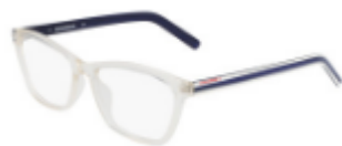
102 Crystal Egret