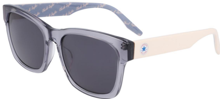
020 Crystal Light Carbon Solid Smoke Lens