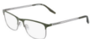
310 Matte Dark Moss