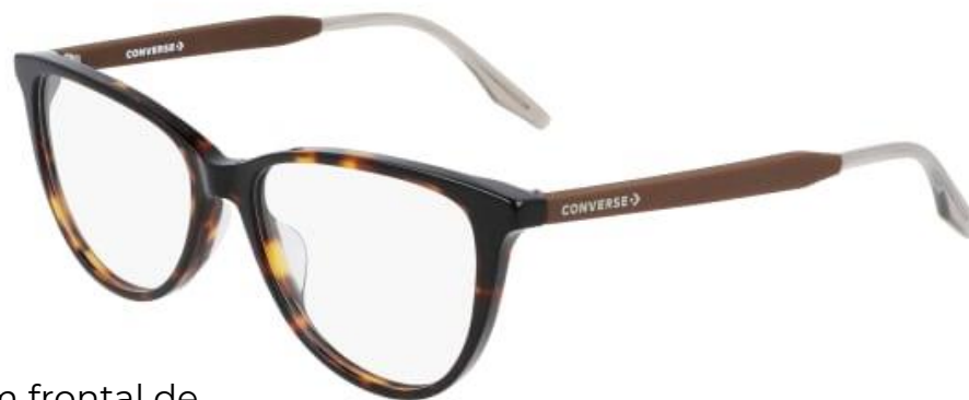
239 Dark Tortoise