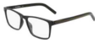
201 Dark Root