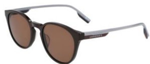
201 Dark Root Solid Brown Lens