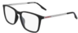
001 Matte Black