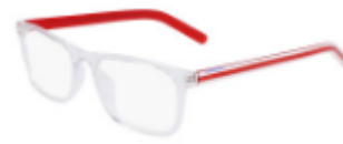
970 Crystal Clear