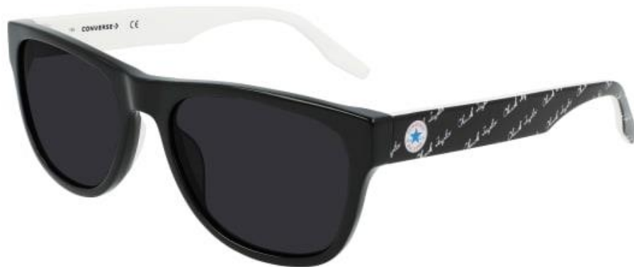
001 Black Solid Smoke Lens