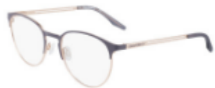
020 Matte Light Carbon