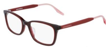
610 Crystal Team Red