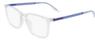
970 Crystal Clear