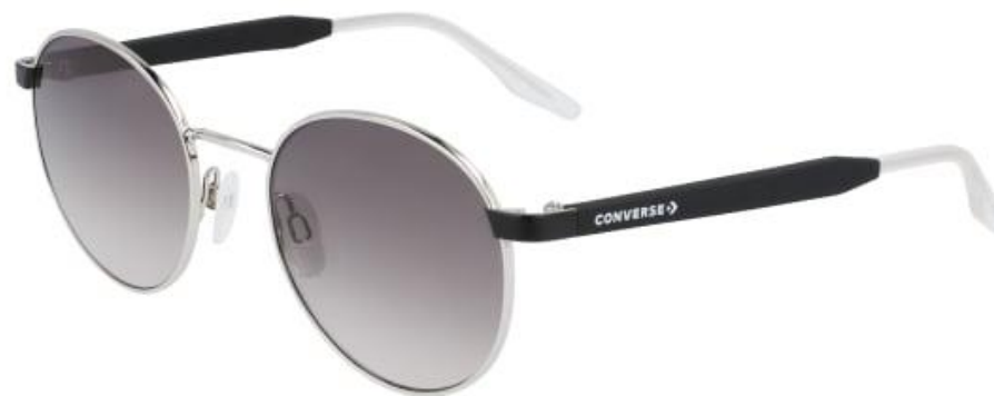
045 Shiny Silver Solid Gradient Lens