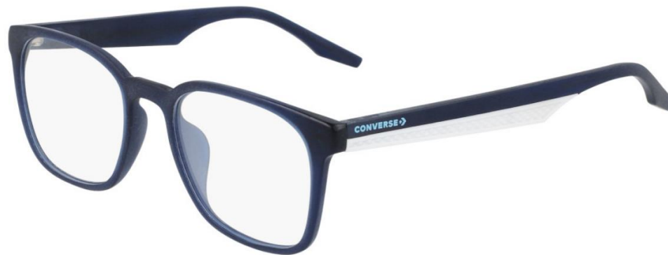
411 Matte Crystal Obsidian