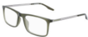
310 Crystal Dark Moss