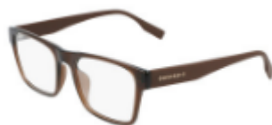
201 Crystal Dark Root