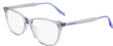
030 Crystal Gravel