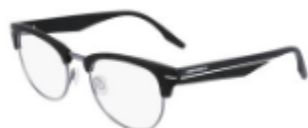
001 Matte Black