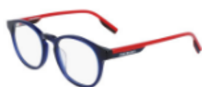
411 Crystal Obsidian