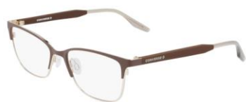
201 Matte Dark Root