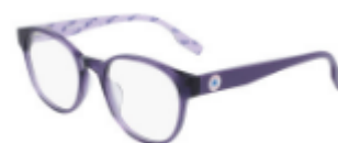
501 Crystal Court Purple