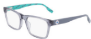
020 Crystal Light Carbon