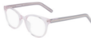
681 Crystal Pink Foam