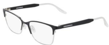
001 Matte Black